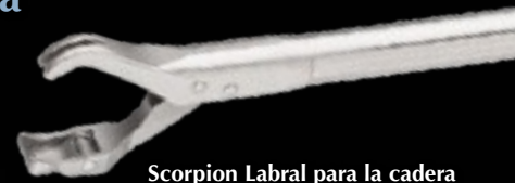
Scorpion Labral para la cadera AR-16991