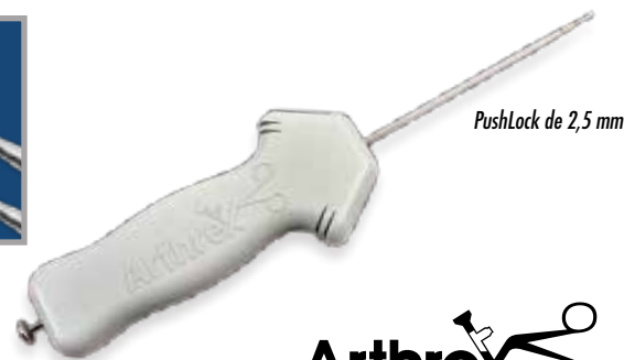
PushLock de 2,5 mm